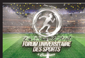
FORUM UNIVERSITAIRE DES SPORTS 2015 2 ème édition