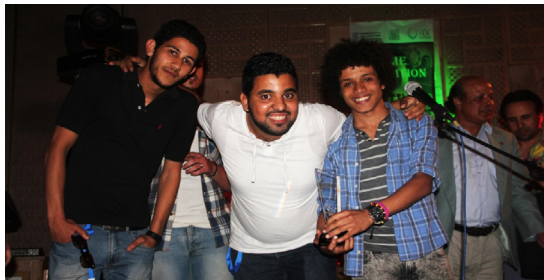
FSJES AIN SBAA GROUPE : ACOSTICOS