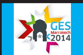
L'ENCG de Casablanca au 5th Global Entrepreneurship Summit 2014 Marrakech (GES)