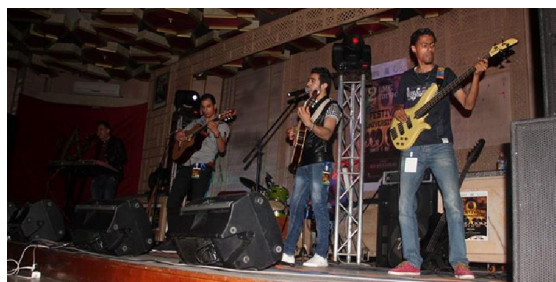
ENITE CASABLANCA (THE FTM MASK)