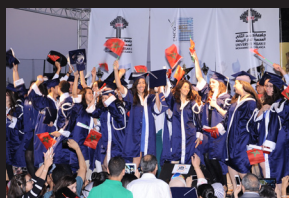
Cérémonie de remise des diplômes 3 ème promotion