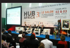
HUB AFRICA 2015 : LE RENDEZ-VOUS ANNUEL DE CREATION ET D'INNOVATION POUR LES ENCGistes