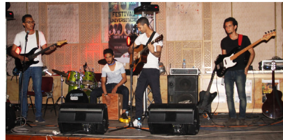
FACULTÉ SOLTAN MOULAY SLIMAN (BENI MELLAL)