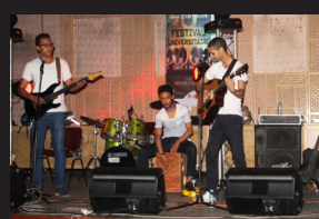
FESTIVAL UNIVERSITAIRE DE LA MUSIQUE