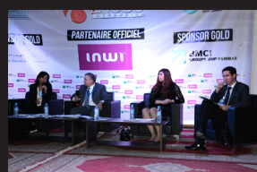
FORUM ENCGC- ENTREPRISE PIC 2015